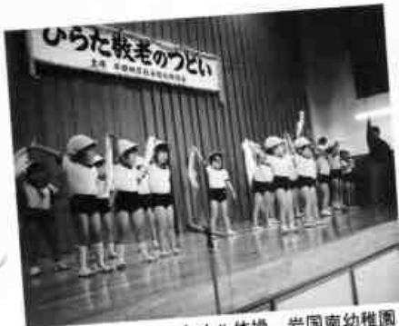
タオル体操 岩国南幼稚園