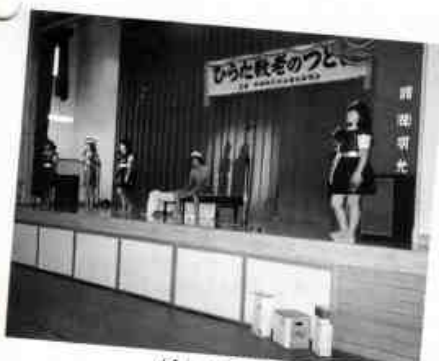
がもと宇宙船 平田小学校