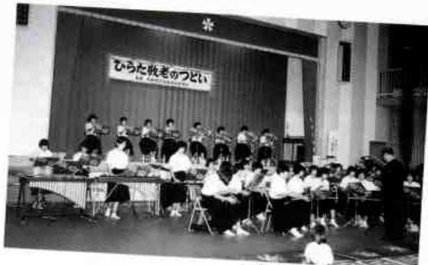
童謡メドレー 平田中学校