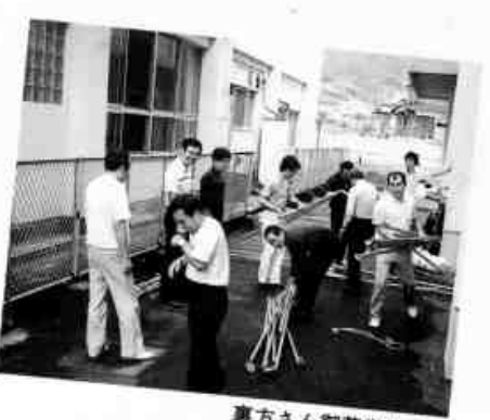
裏方さん御苦労さん