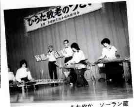
さわやか ソーラン節