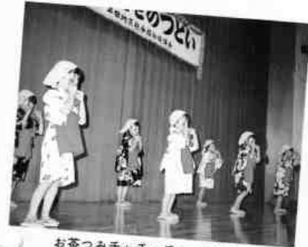
お茶つみチャチャチャ 梅が丘保育園