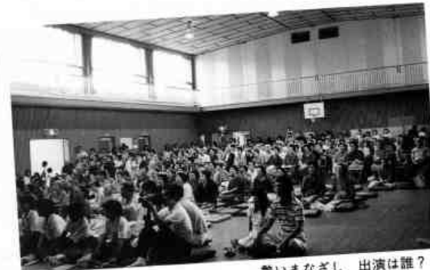
熱いなごし 出演は誰?