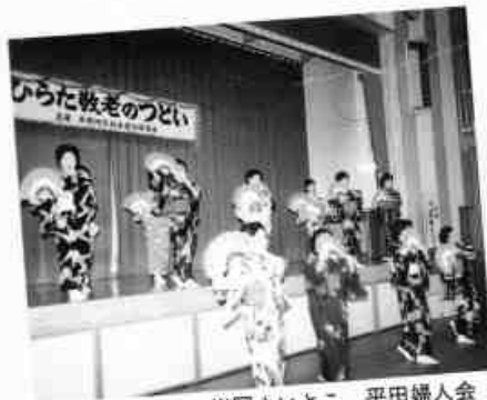
岩国よいとこ 平田婦人会