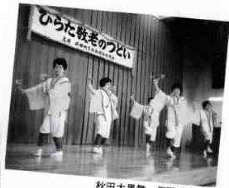
秋田大黒舞 民謡同好会